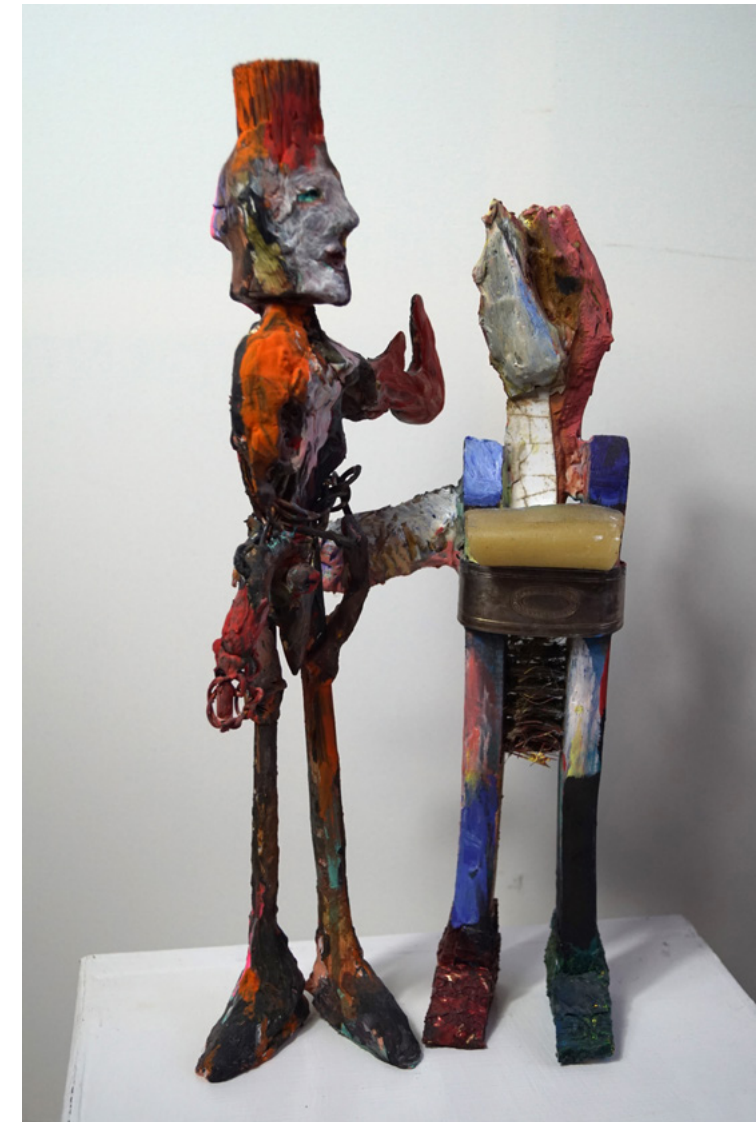
Abbildungen: Titelbild: Zeitläufe , 2026 (Ausschnitt) Rückseite: Avatar 2024, 50 x 40 cm Innen: Humanoides Paar , 2024, Höhe 40 cm Portrait:

Der Markgräfler Kunstpreis der Stiftung der Sparkasse Markgräflerland zur Förderung von Kunst und Kultur ist mit 5.000 Euro dotiert. Er wird jährlich an professionelle regionale Künstlerinnen und Künstler der Bildenden Kunst oder der Musik verliehen.